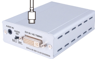
DVI 到 3G SDI 轉換器