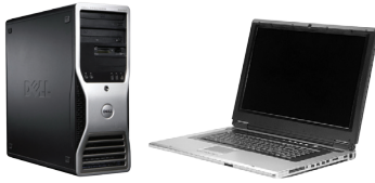
PC or NB